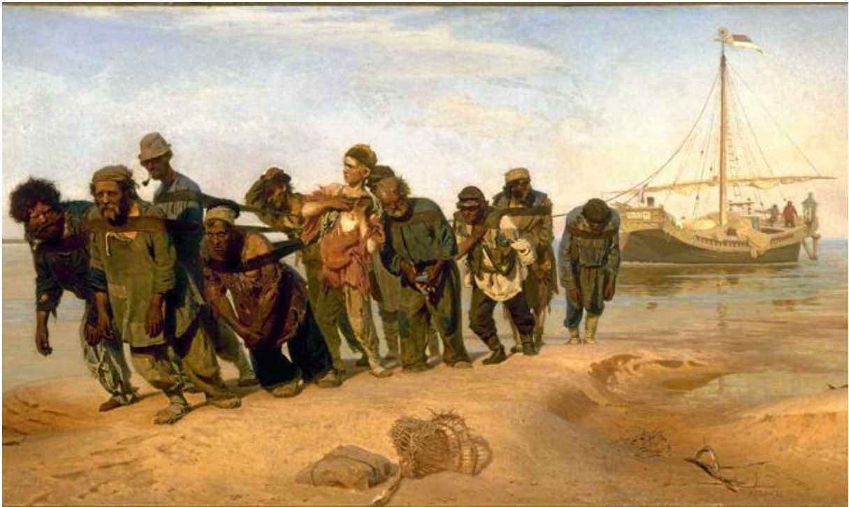
En av höjdpunkterna i utställningen är Ilja Repins berömda "Pråmdragare vid Volga", ett av de mest välkända verken i rysk konst överhuvudtaget.