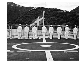
Halning av fanan ombord på HMS Carlskrona. i skymningen.