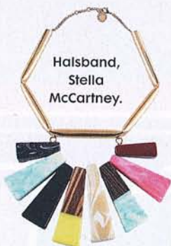
Halsband, Stella McCartney.

Bohochict, lyxigt och färgstarkt är ledorden för resegarderoben.