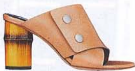
Sandalett, Acne studios.