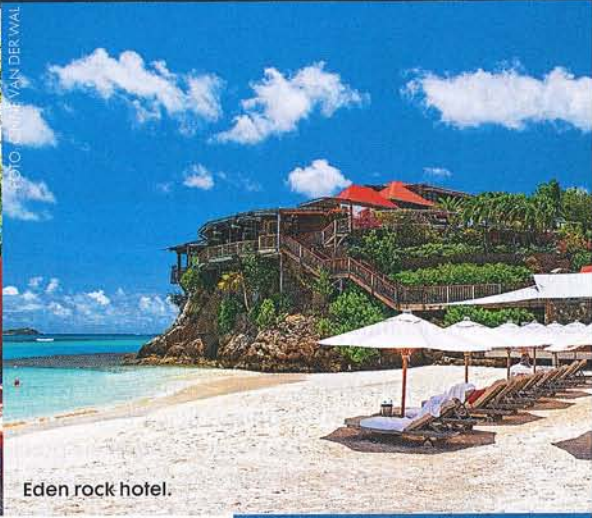
Eden rock hotel.