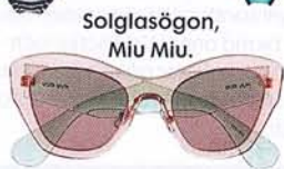
Solglasögon, Miu Miu.