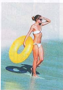
Olivia Palermo simmar lugnt med badring.