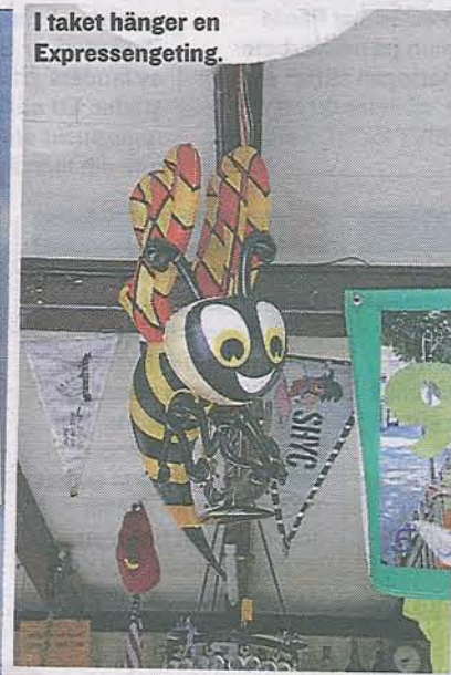
I taket hänger en Expressengeting.