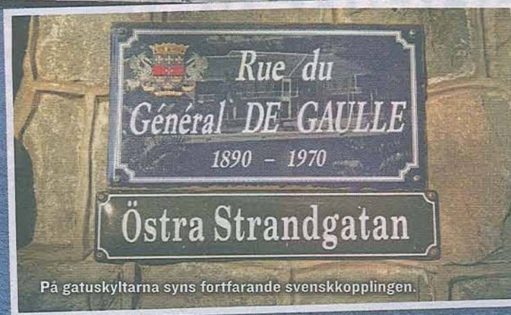
På gatuskyltarna syns fortfarande svenskkopplingen.