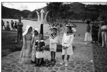
Den enda Neptunigaffeln utanför Sveriges gränser finns sedan 1996 uppsatt utanför Wall House. Skänkt av Neptuniorden